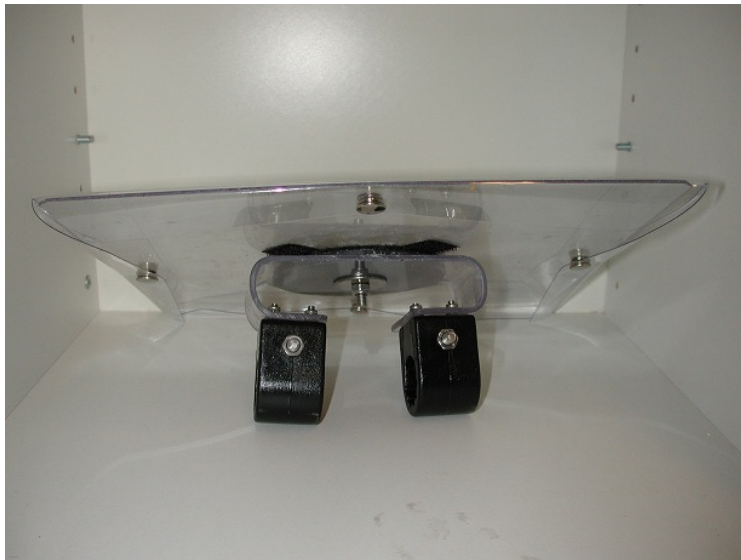
Kartstället år 2003

Sedan 2002 har jag tillverkat kartställ för MTB. Det första gjorde jag för att jag behövde ett själv men så upptäckte kompisar mina kartställ och undrade om jag kunde göra kartställ till dem också.